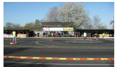
Strecke, Fahrerstand, Fahrerlager 1+2