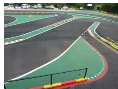
Rennstrecke, rechter Teil