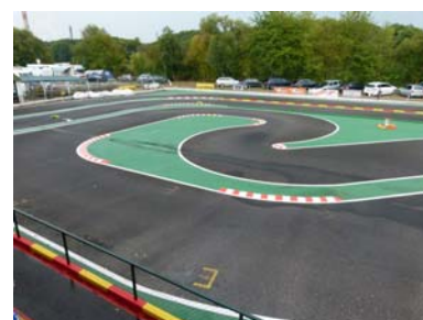
Rennstrecke, linker Teil