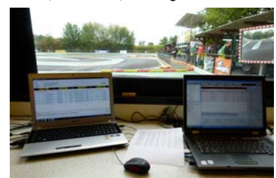
Zeitnahme: RC4-Standard von MyLaps