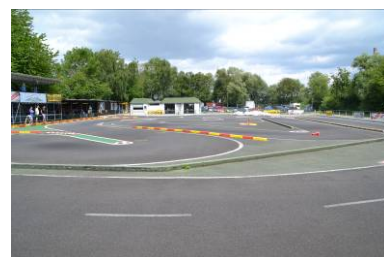
Strecke, Fahrerstand, Fahrerlager, Cafeteria